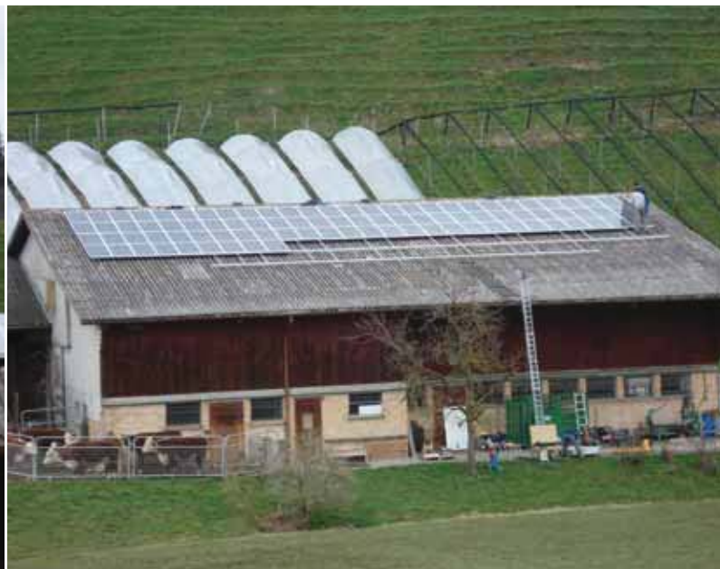
Alla fine di marzo 2008 sono stati montati sul tetto della stalla e del fienile 160 metri quadri di moduli solari.