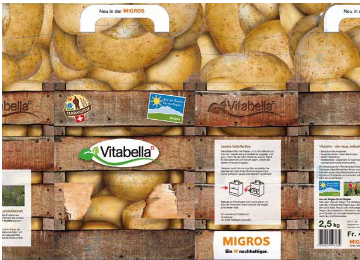
Già in vendita come patata PI della regione: imballaggio per la nuova varietà Vitabella nel canale Migros.