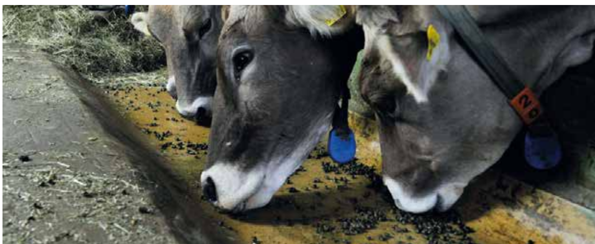
I cubetti di trifoglio bianco si sono affermati nel foraggiamento del bestiame da latte.