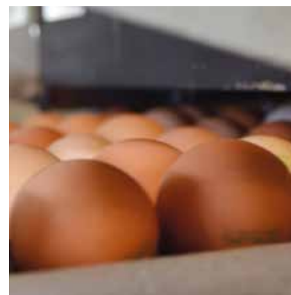
L'uovo bio rimane a 45,5 cts.

In autunno la commissione di esperti in materia di uova e Bio Suisse hanno condotto delle trattative con i commercianti per definire il futuro prezzo indicativo delle uova bio. Per il 2015, visto che la situazione del mercato è rimasta