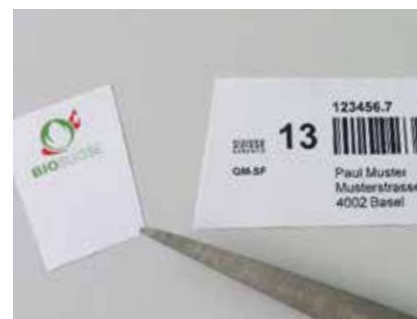
Le nuove vignette per la commercializzazione di animali di Bio Suisse.

Le aziende Gemma recentemente hanno ricevuto le vignette per la commercializzazione degli animali. Le vignette vanno incollate sui documenti ufficiali di accompagnamento degli animali. L'azienda è responsabile dell'ordinazione tempestiva e della dichiarazione corretta sulle vignette. Il segretariato centrale è a disposizione per eventuali domande, tel. 061 204 66 45 o pm-fleisch@bio-suisse.ch . Le vignette «Bio Weide-Beef» vanno ordinate direttamente presso bio.inspecta . Oltre al marchio Gemma le