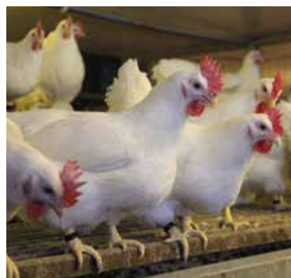
La gallina a duplice attitudine Dual.

deposizione con un consumo di foraggio relativamente modesto, inferiore a 120 grammi per uovo. Meierhans stima però che con Dual risulteranno maggiori costi compresi tra il 35 e il 45 per cento. Nel contempo neppure l'accrescimento dei polli suscita grande euforia. Non sono in nessun caso in grado di competere con gli ibridi convenzionali. akr