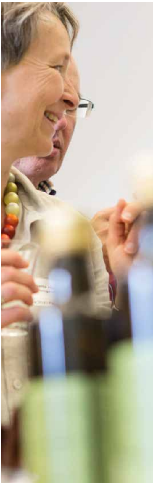
I prodotti premiati saranno presentati ai media l'estate prossima.

Anche quest'anno Bio Suisse assegnerà la Gemma bio Gourmet. L'intento dell'associazione è di dare visibilità a creazioni innovative ed eccellenti.