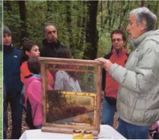
L'apicoltura, un mondo sempre affascinante.

lentemente in Capriasca. Si tratta di una collezione primaria, gestita all'Azienda biologica fattoria in Red di Lelgio, che i partecipanti alla gita hanno poi visitato nel pomeriggio.