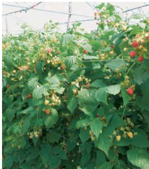
Per diversi frutti bio esistono ottime possibilità di smercio.