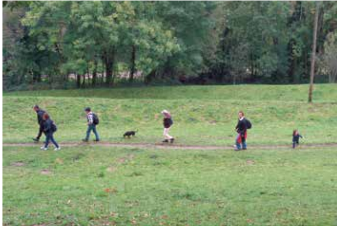
Nella campagna di Bigorio.