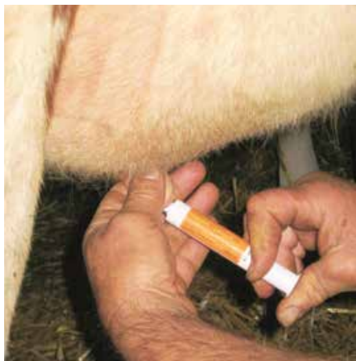
Le modifiche della norma sull'uso di antibiotici non entreranno in vigore l'1.1.2016.