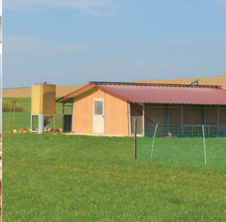
Il sistema di stabulazione fisso per l'ingrasso di polli di Laurent Godel permette un'alimentazione automatizzata.